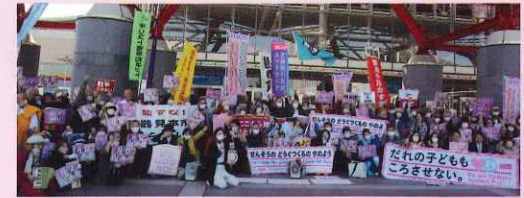
2023年3月のDSEI JAPANへの抗議アクション