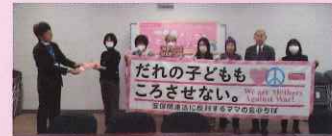
2025年1月に千葉県へ署名提出