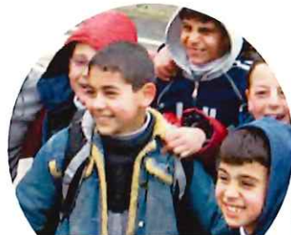
パレスチナの子どもたち

パレスチナの人々は、聖書の時代から羊やヤギを遊牧して暮らしてきました。農業が盛んになった今も、伝統的な遊牧が見られます。