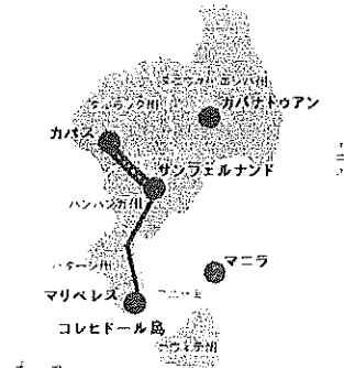
(注2) 死の行進ルート