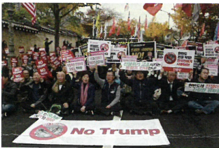
トランプ訪韓反対で大統領府前に座り込む人々(11/7)